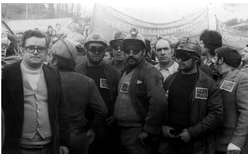
A la salida de un encierro en un pozo