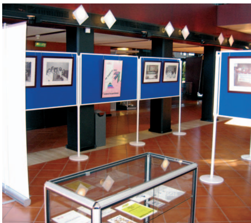
Vista parcial de la exposición "La solidaridad en la oficina", en el Palacio de Congresos de Las Palmas

La segunda exposición en la que ha participado el AHT tuvo lugar durante el Segundo Congreso Estatal de COMFÍA-CCOO que se celebró en el Auditorio Alfredo Krauss de Las Palmas de Gran Canaria, los pasados 10, 11 y 12 de mayo. La exposición llevaba por título La Solidaridad en la oficina . A través de fotografías, carteles, folletos y prensa sindical, hasta reunir más de 120 piezas, narra diversos aspectos de la trayectoria de las antiguas federaciones de Banca y Ahorro, por un lado, y Seguros, por otro, que se fusionaron en COMFÍA-CCOO. De este modo aparece reflejada la lucha por las libertades, la participación sindical de las mujeres, las elecciones sindicales, los procesos de negociación colectiva o los diferentes congresos que han ido jalonando la vida sindical de estas organizaciones.