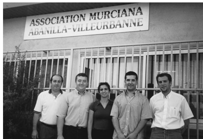
Miembros de la Junta Directiva de la Asociación Murciana Abanilla-Villeurbanne.