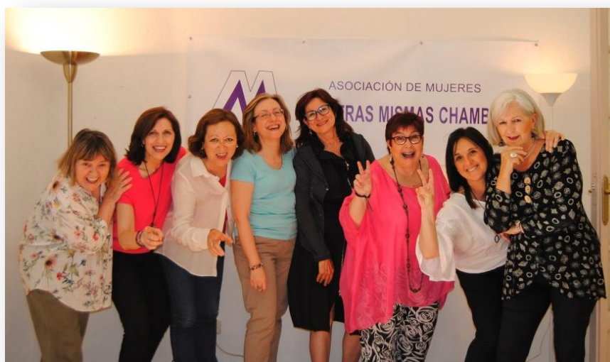
Foto de grupo de todas las presidentas de la Asociación.

La lucha por la igualdad no descansa y mientras la desigualdad siga manifestándose cultural, laboral, social y políticamente, allí estaremos Nosotras Mismas para denunciarlo y ofrecer soluciones junto con el Movimiento Feminista”.