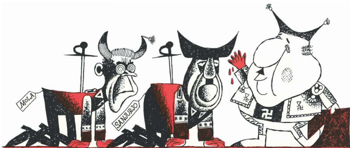
Mola, Sanjurjo y Franco (caricatura de Vázquez de Sola)

En los próximos meses aparecerá información más detallada sobre el VI Encuentro (relatores, plazos y normas de inscripción de comunicaciones, etcétera), a cargo de los propios organizadores. El Archivo de Historia del Trabajo, como el resto de miembros de la Red de Archivos Históricos de CCOO, colaborará en la difusión de toda la información relativa a estos Encuentros, al objeto de que cuenten con una participación importante.