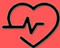
SALUD DE VANGUARDIA