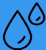
CICLO del AGUA